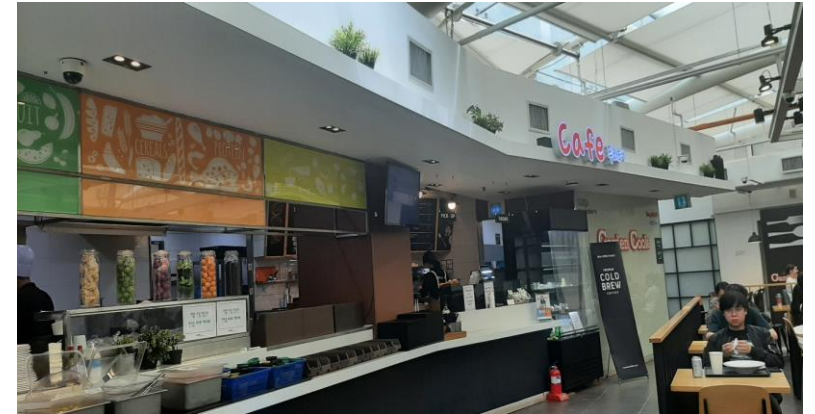
세 61내 송악생외일동